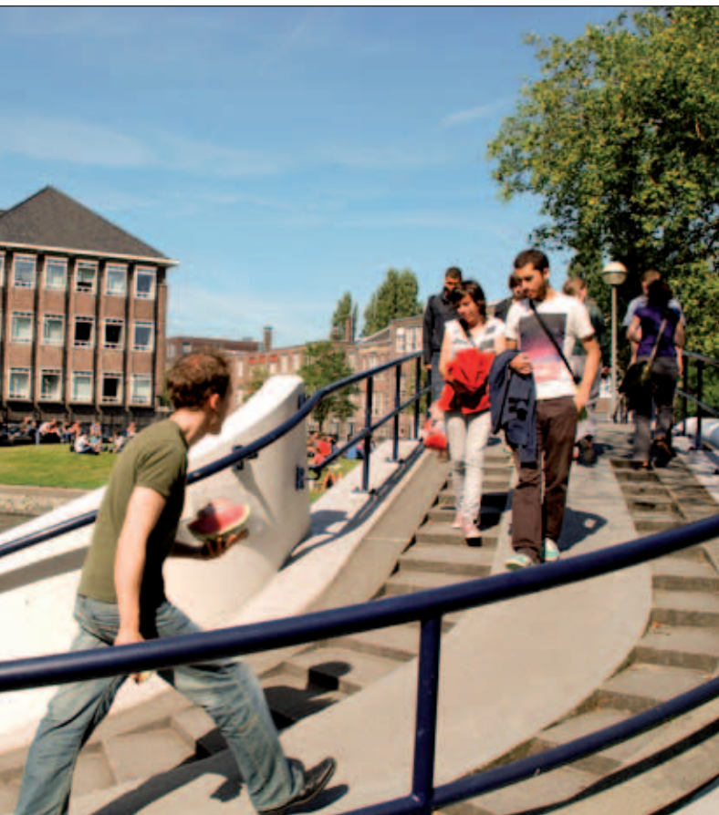
Op en rond het Roeterseiland