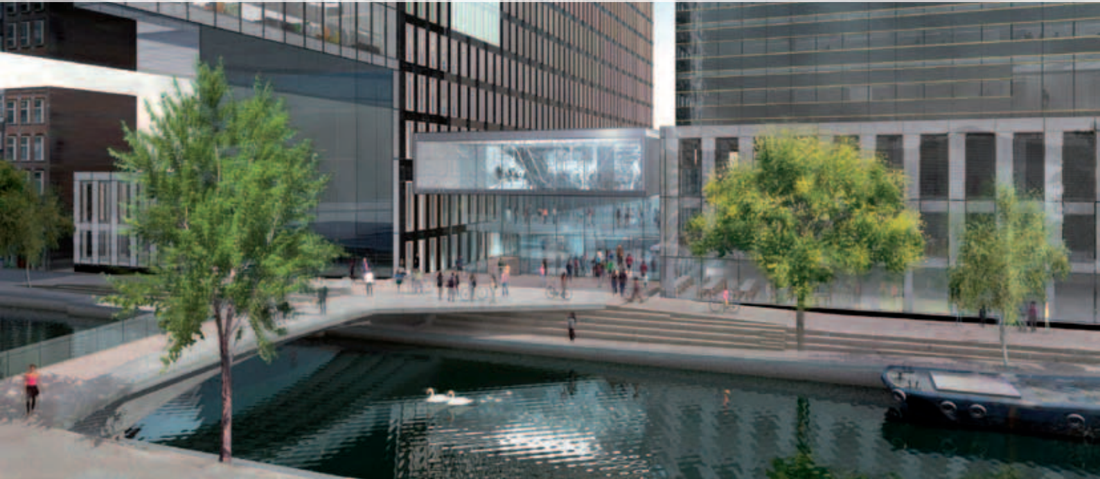
Impressie van de brug bij de nieuwe universiteitsgebouwen rond de Nieuwe Achtergracht